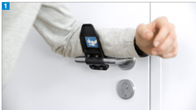
1 Poser l'avant-bras sur l'accessoire

bactéries et autres micro-organismes, et réduit donc les risques d'infection.