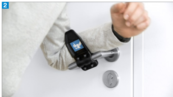
2 Spingere l'avambraccio verso il basso e aprire/chiedere la porta