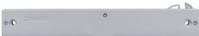
Silento Chiuso 70