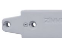
Silento Chiuso Lungo 100 mit Verlängerung