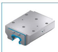
KBH 系列 夹紧和制动元件