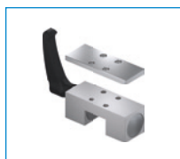
HK 系列 夹紧元件