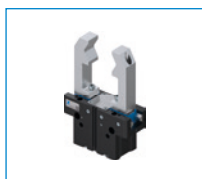
Seria GPP5000 Chwytaki dwuszczkowe równoległe