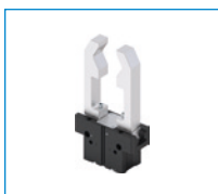
Seria GPP5000AL Chwytaki dwuszczkowe równoległe