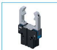
Chwytki dwuszcękowe kątowe