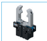
Chwytki dwuszcękowe równoległe