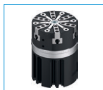
Chwytki do zastosowań specjalnych