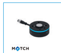
MATCH - Moduł robota