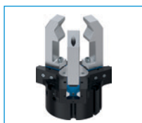
Chwytki trójszcękowe koncentryczne