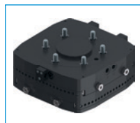
Układy wyrównania osi