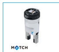
MATCH - Chwytki