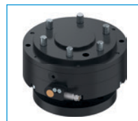
Ochrona przed zderzeniem