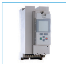
Convertitore di frequenza