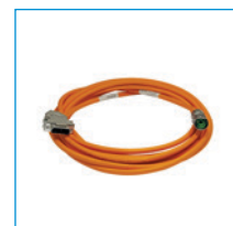
Linee di segnali