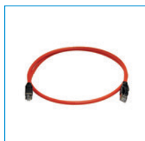
Adattatore Convertitore di frequenza