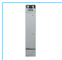
Unità di comando