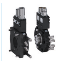
로봇 교체 장치