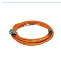
Linee di segnali