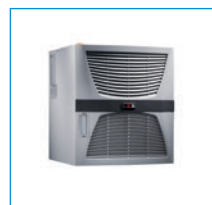
Set di connettori/ Gruppo di raffreddamento