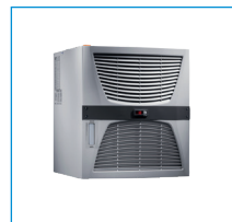
Kühlaggregate / Verbindersatz