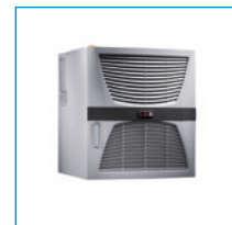
냉각 장치/ 커넥터 세트