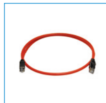
어댑터 주파수 변환기