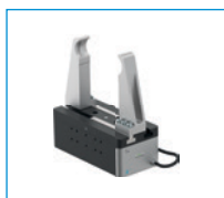
Seria GEH6000IL Chwytniki dwuszcękowe równoległe o dużym skoku