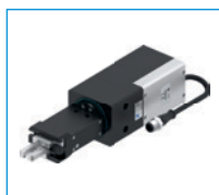
Seria REP2000 Chwytniki dwuszcękowe równoległe obrotowe