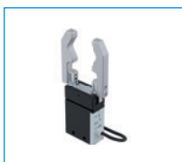
Seria GEP2000 Chwytniki dwuszcękowe równoległe