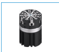
Seria GS Chwytnik montażowy O-ringów z zewnątrz