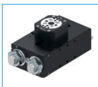
Seria SF-C Płaskie mechanizmy obrotowe