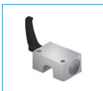
Seria HKR Element zaciskowy