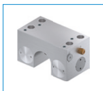
Seria MKR Element zaciskowy