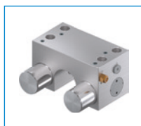
Seria MKRS Element zaciskowy