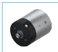
Seria RBPS Element zaciskowy i hamujący