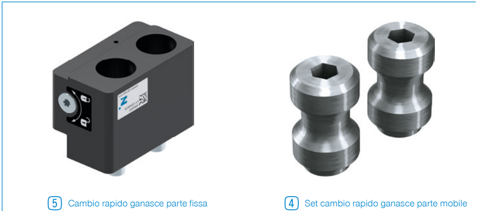
5 Cambio rapido ganasce parte fissa