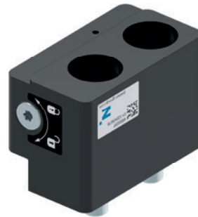
5 Część stała szczęki wymiennej