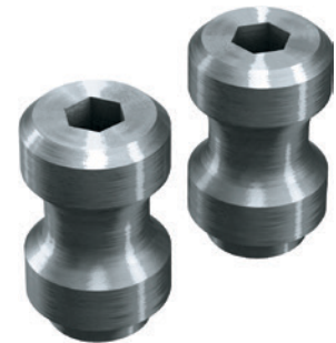
4 Zestaw elementów luźnych do szczęki wymiennej