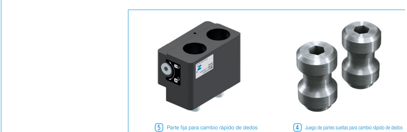
5 Parte fija para cambio rápido de dedos